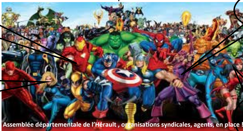
Assemblée départementale de l'Hérault , organisations syndicales, agents, en place !

Bientôt le SUPER Département de l' HÉROS ?